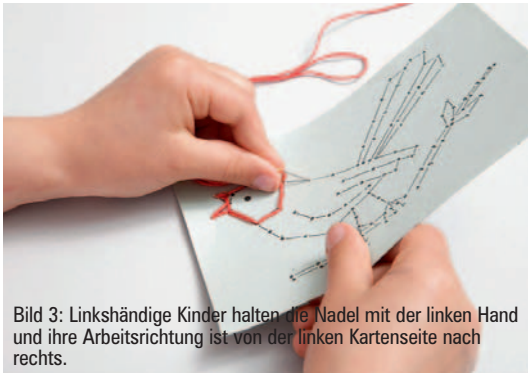
Bild 3: Linkshändige Kinder halten die Nadel mit der linken Hand und ihre Arbeitsrichtung ist von der linken Kartenseite nach rechts.